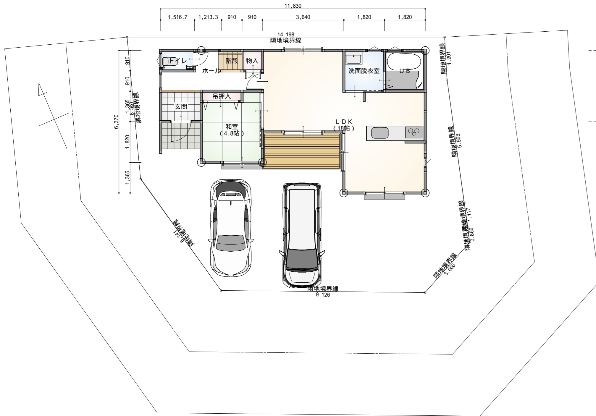
1階 平面図 S:1/100